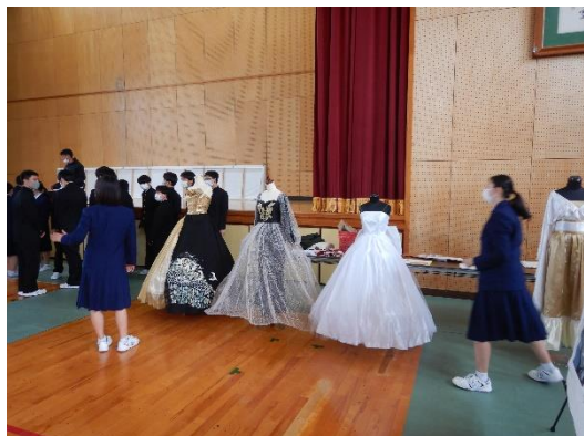
家政科の課題研究の展示