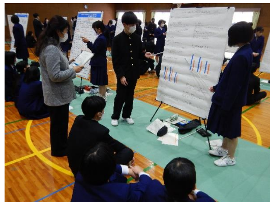
第2体育館の発表の様子