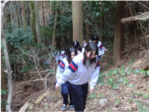
慣れない山道でもがんばります