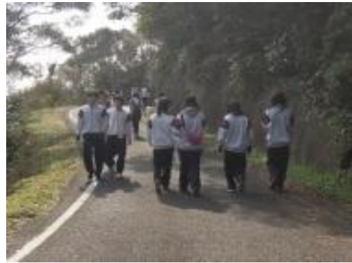
折り返している生徒とすれ違います