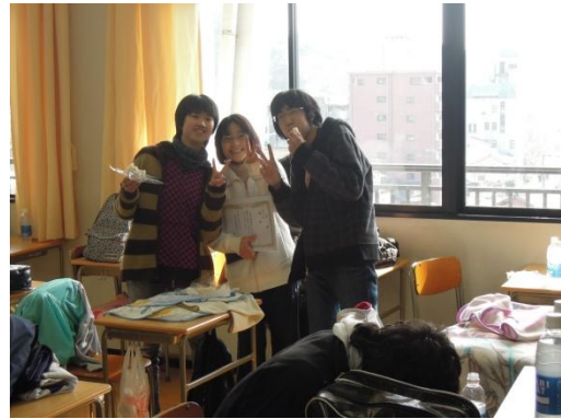
肉まんと賞状と担任の先生と