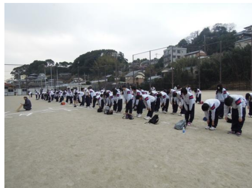
準備体操をしっかりと