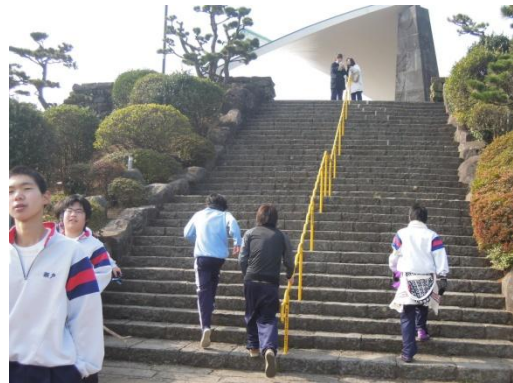
折り返しチェックポイントだ！