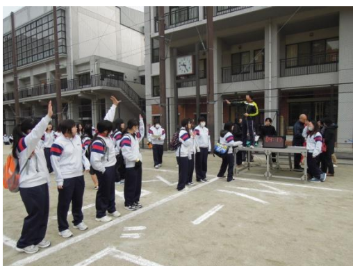
用意はいいですか? 「は〜い!」