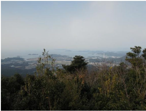
将冠岳頂上からの景色