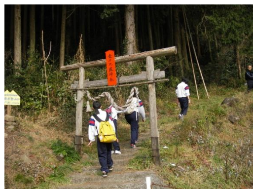
将冠岳登山道入り口