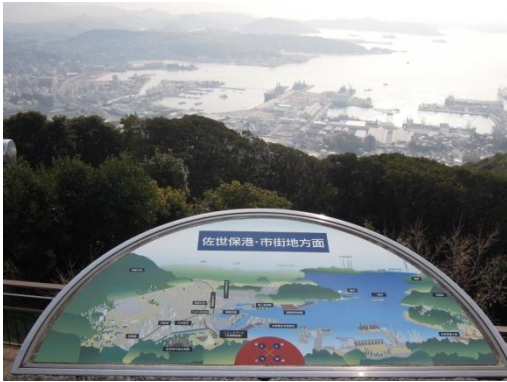
弓張岳展望台からの風景