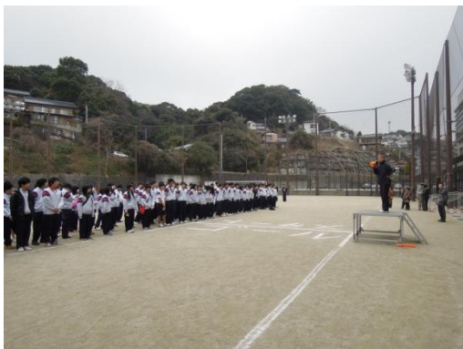
開会式 校長先生のお話

ほぼ全員が完歩し、差し入れとして参加者全員に肉まん、あんまん、スポーツドリンクが配られ、おいしくいただきました。生徒たちも達成感や、充実感を味わうことができた良い大会でした。