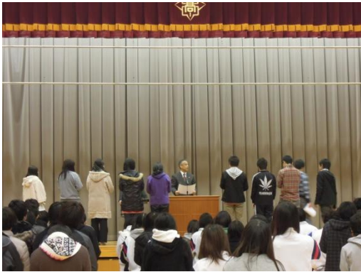
表彰式「よくがんばりました」