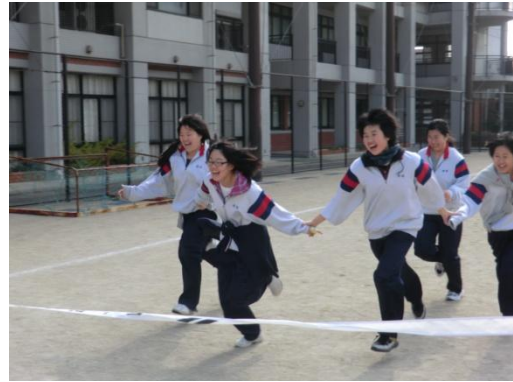
「やったー！ゴールだー！」