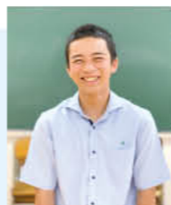
男子バレーボール部 1年生 川瀬中学校出身

私たちは文武両道を目指し、しっかりと勉強と部活の両立を行っています。そして、南高のバレー部として常に学校を引っ張る存在として努力し、今まで支えてくださった人への感謝と人としてのマナーや礼儀作法を忘れずに部活動に励んでいます。