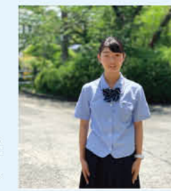
吹奏楽部 1年生 川瀬中学校出身

部活動をすることで、出身中学校が遠くともクラスを超えて仲良くなり、学年を超えて先輩方からいろいろな面でアドバイスをいただけます。入学した当初は、勉強と部活動の両立は不安でした。