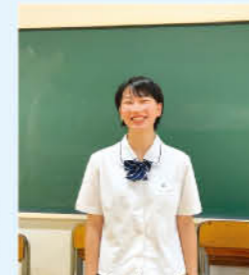
女子バスケットボール部 1年生 日野中学校出身

女子バスケットボール部は、インターハイへの出場経験もあるとても活発な部活動です。チームとしての明確な目標を持ち、それに向けて練習を行っています。先輩と後輩の仲がとてもよいですが、練習では緊張感を持ちバスケットを楽しんでいます。