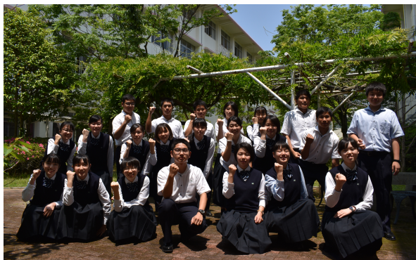
今年度の生徒会メンバーの集合写真

今年度の生徒会役員が新しく活動を開始し、さまざまなことに挑戦していきます。皆様のご協力をお願いします。