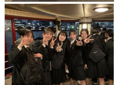
↑ 修学旅行中の様子