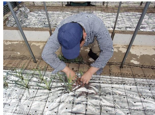
1本ずつ丁寧に植えます