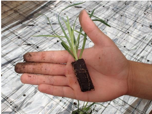
カーネーションの苗

7月12日（金曜日）8種類（スタンダード2種類・スプレー4種類）1200本の苗を3年草花専攻生8名で植えました。