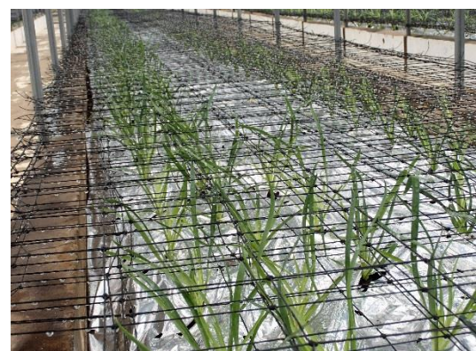
全て植え終わりました