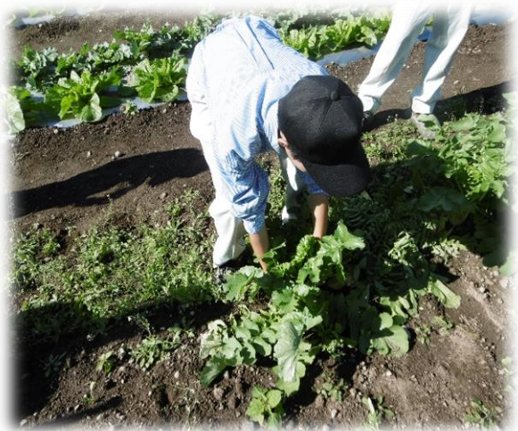
ダイコンの引き抜き