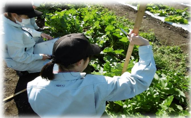
ダイコンの葉の長さ計測