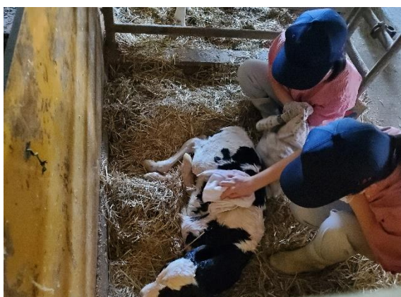
産まれたてで濡れているので体温が下がらないように体をふいています!