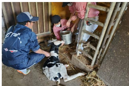
母牛から搾った乳を子牛に飲ませています!