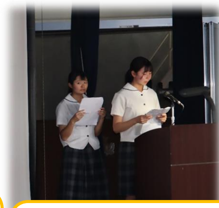
【Ⅲ類】 『楽しく畜産を学ぼう』 ～コロナ禍でも体験学習を～