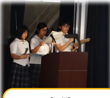
【Ⅱ類】 『ジオの恵みPRプロジェクト』 ～まぼろしの島原茶に さらなる付加価値を～