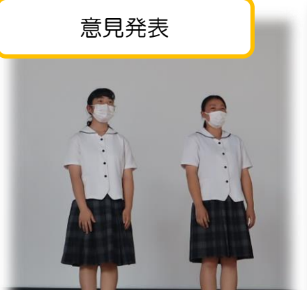
【Ⅰ類】 『コチョウランの栽培に ついての研究』