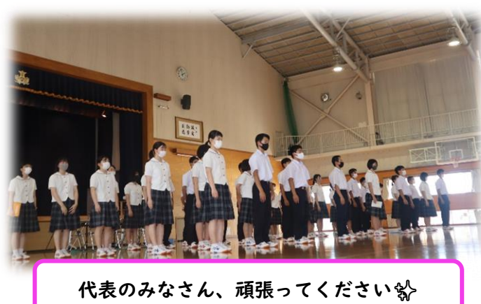
代表のみなさん、頑張ってください☆