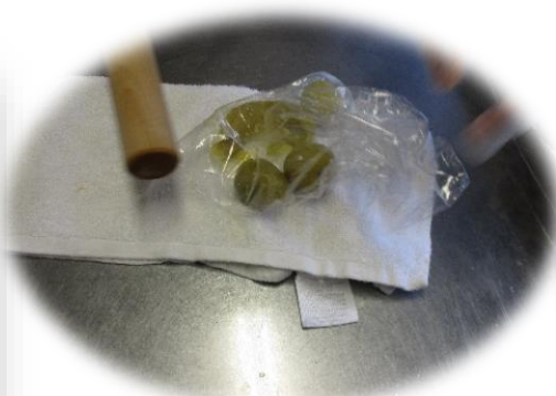
・カリカリ梅漬け