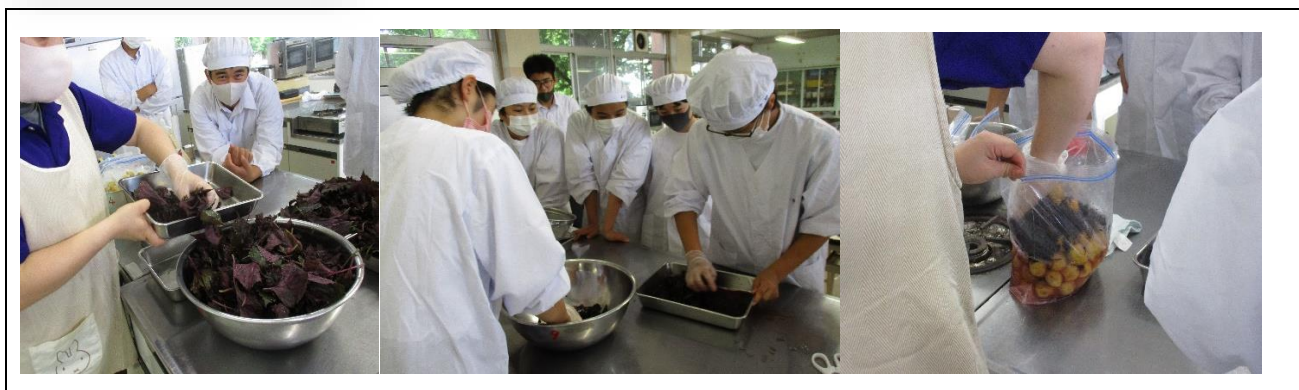
・梅のシロップ漬け