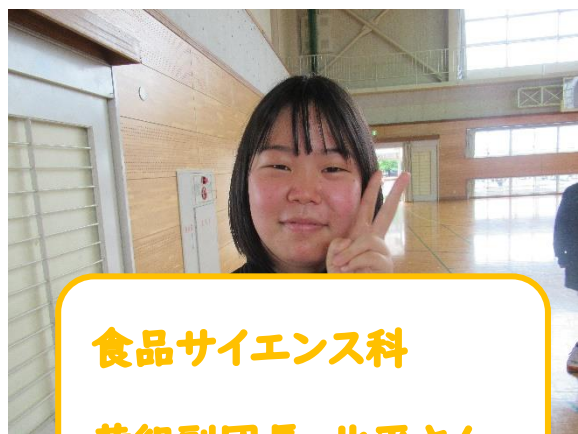
食品サイエンス科