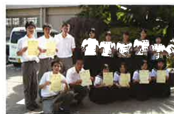
【全商簿記検定 1級合格者】 (6月末現在)