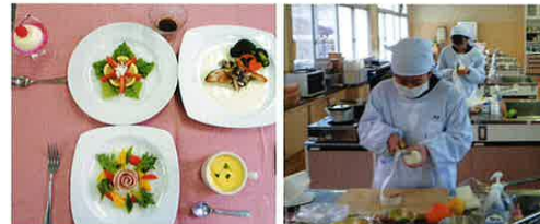
家庭科技術検定（食物調理1級）

高看への進学や作業療法士や理学療法士養成の専門学校、福祉・介護系の短期大学や4年制大学に進学します。介護職として病院への就職をします。 栄養士や管理栄養士などの国家資格を目指して、短大や大学に進学します。調理系の就職をします。