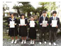
【平成24年度日商簿記検定 2級合格者】

電卓検定やビジネス文書検定では、機器操作を素早く正確に操作する技術が身に付きます。