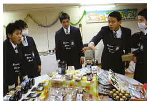
店内ミーティングの様子