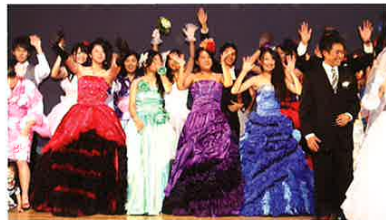
文化祭（ファッションショー）

幼児教育・保育系の4年制大学や短大へ進学します。 服飾・ファッションデザインの短大や専門学校への進学、被服系の就職を目指します。