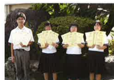
【全商4・3種目 1級合格者】