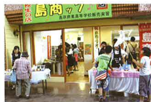
島商ッ店頭の様子

ビジネスの基礎・基本の能力を身に付け、 ビジネス社会に貢献できる人材を育成します。