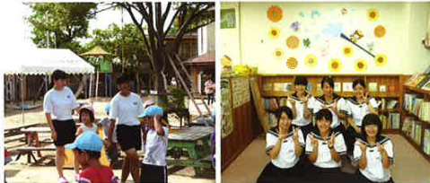
保育園実習 立体壁画（島原市立図書館）