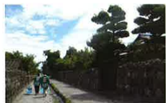
【てんびん棒による移動販売の様子】