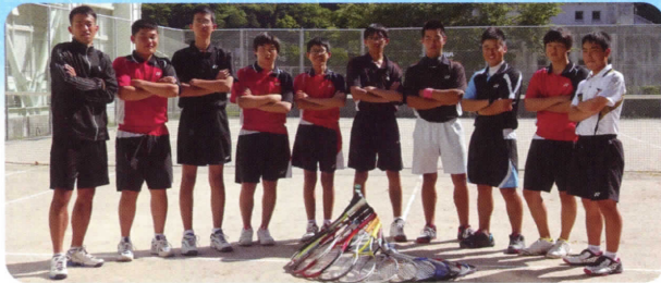
■ソフトテニス (男子)