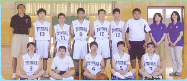
■バスケットボール (男子)