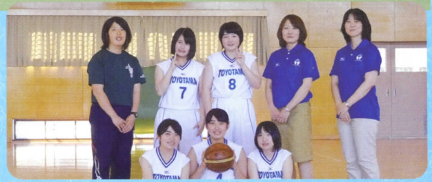
■バスケットボール (女子)