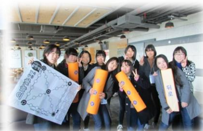
伝統の遊び（コンノリ）