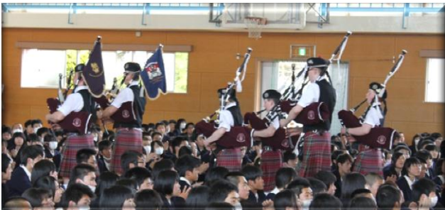
スコットランド バグパイプ演奏会が 4月27日(月)に行われました!