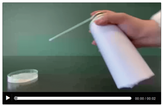
動画1 プロパンガスでシャボン玉をつくる