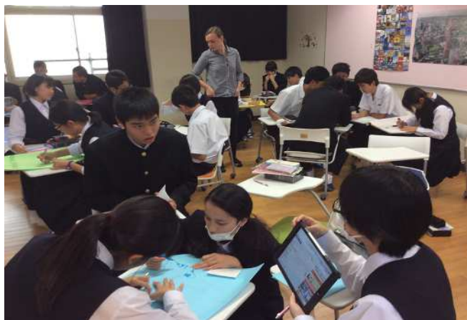
↑ iPadを用いたアクティブラーニング型授業