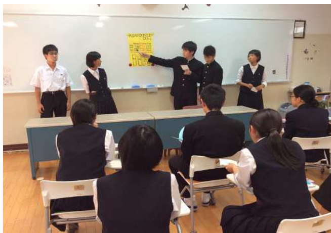
↑ 英語によるポスター発表