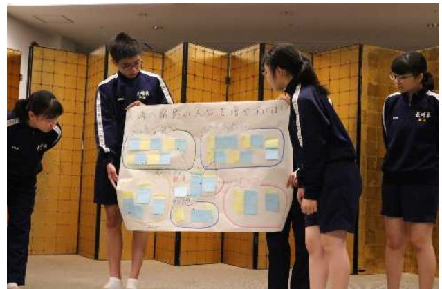
↑ 「長崎の離島の人口を増やすには」をテーマにポスター発表