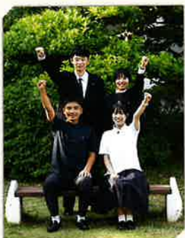
School Guide 2026