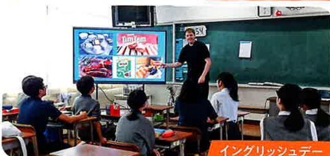
イングリッシュデー