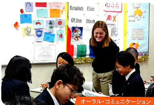
オーラル・コミュニケーション