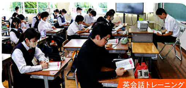
英会話トレーニング

ALT(外国語指導助手)1名、日本人教師1名の2名によるチームティーチングの授業で、全学年週に1時間設定されています。