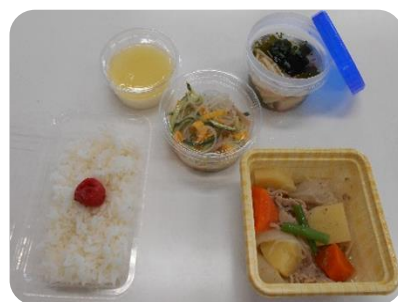
コロナウイルス感染症対策として今回もお弁当を持参しました。