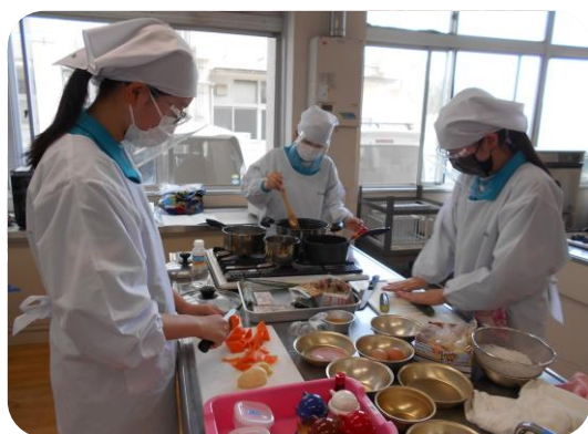
分量や火加減をしっかりと確認しながら作ります。

今回のメニューは肉じゃが、春雨の和え物、えのきとかまぼこのお吸い物、2色ゼリーです。