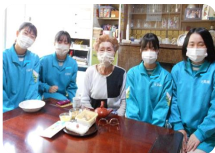
「お元気ですか！短い時間しかお話できませんが、お会いできて嬉しいです！」