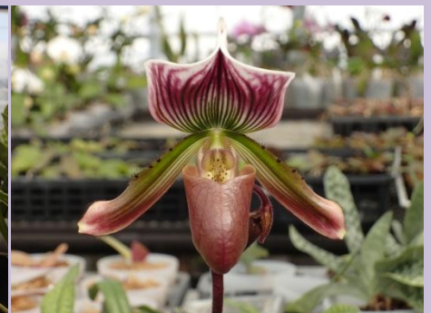
パフィオペディラム