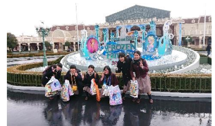
東京ディズニーランド