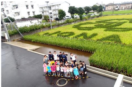
田んぼアート交流

ぼアート鑑賞会、10月の稲刈りは雨のため中止したものの、11月は保育園で栽培した黒米で炊飯とカレー作り、12月には稲のリースづくりで交流を行いました。毎回土曜日の午前中に実施しています。今後は2月にまとめ交流を行う予定です。