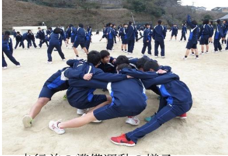
走行前の準備運動の様子

2月9日(金)、マラソン大会を開催致しました。男子9km、女子6kmの道のりを各自が一生懸命走り、全員完走することができました。大会終了後、保護者の皆様が作ってくださった豚汁を全員おいしくいただきました。