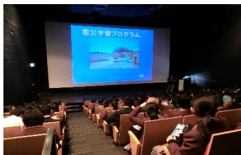
アクアマリンふくしま

2年生は1月30日(火)からの4日間、修学旅行に行きました。初日は、福島県にある水族館(アクアマリンふくしま)で東日本大震災について学びました。2日目、3日目はスキー研修、最終日は東京ディズニーランドに行きました。修学旅行を通して集団での社会性・協調性を養い、さらに生涯の思い出を作ることができました。