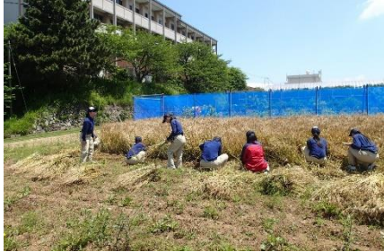
小麦収穫の様子(手刈り)