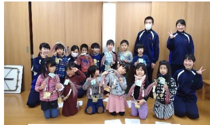
稲のリース作り交流