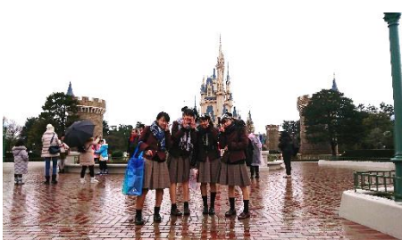
東京ディズニーランド