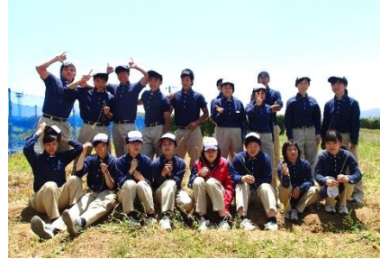
3年 食料科学系列生徒