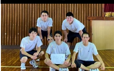
男子バスケット 3年1組A