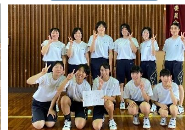
女子バレーボール 3年1・2組