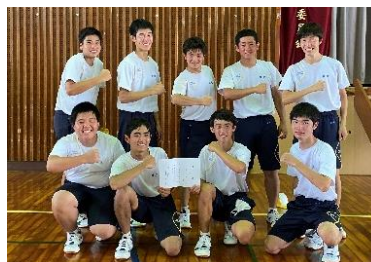
男子サッカー 3年3・4組