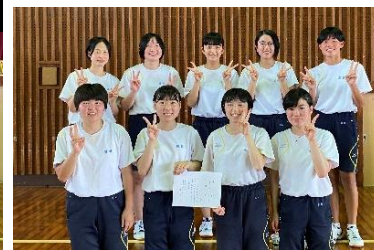
女子ドッチボール 3年3組