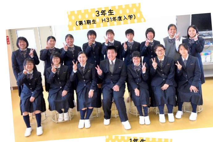
3年生 (第1期生 H31年度入学)

私は毎日バスで、深江から口加高校に通っています。卒業後は看護師を目指して専門学校への進学を目指しているので、バスに乗っている時間は、読書や課題などを行っています。福祉科は学年の壁を越えて仲が良く、互いに支え合って笑顔の絶えない毎日を過ごしています。私たちと一緒に楽しく医療や福祉について学んでいきませんか？