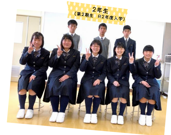
2年生 (第2期生 R2年度入学)