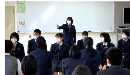
学校生活の悩みも気軽に相談しやすいよ! 先輩と後輩との距離がグッと近まるよ!