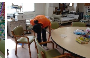
デイサービスで実習を行う1年生