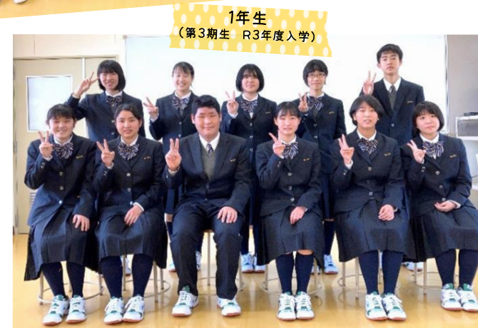
1年生 (第3期生 R3年度入学)