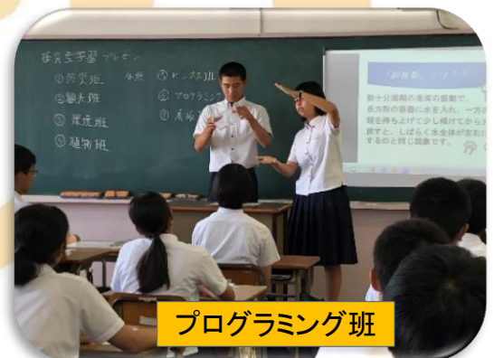
プログラミング班