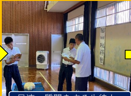
早速、質問をする生徒も...