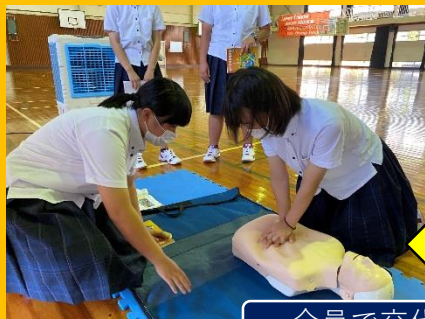
全員で交代しながら...