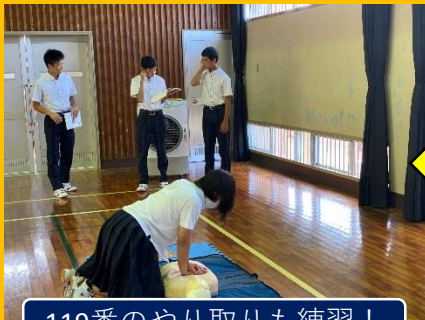
119番のやり取りも練習！