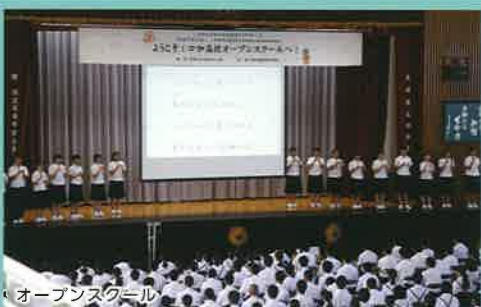
オープンスクール