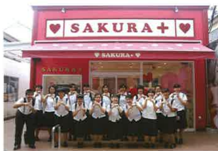
障がい者施設での校外研修