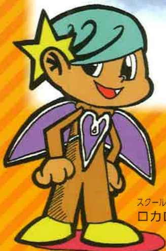
スクールキャラクター □カ□ちゃん