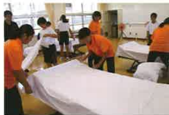
介護実習 (ベッドメイキング)