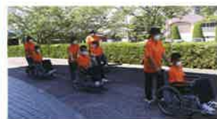
介護実習 (車椅子移動支援)