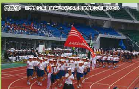
高総体 令和2年度は中止のため写真は令和元年度のもの