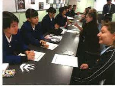
オーストラリア海外研修②