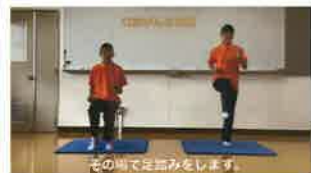
福祉科考案「口加げんき体操」