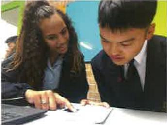
オーストラリア海外研修①