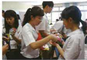
香港の学生との交流会