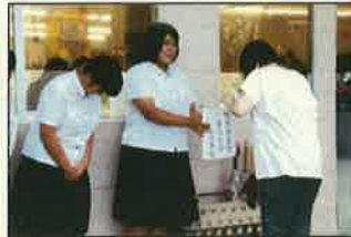
熊本県豪雨災害街頭募金