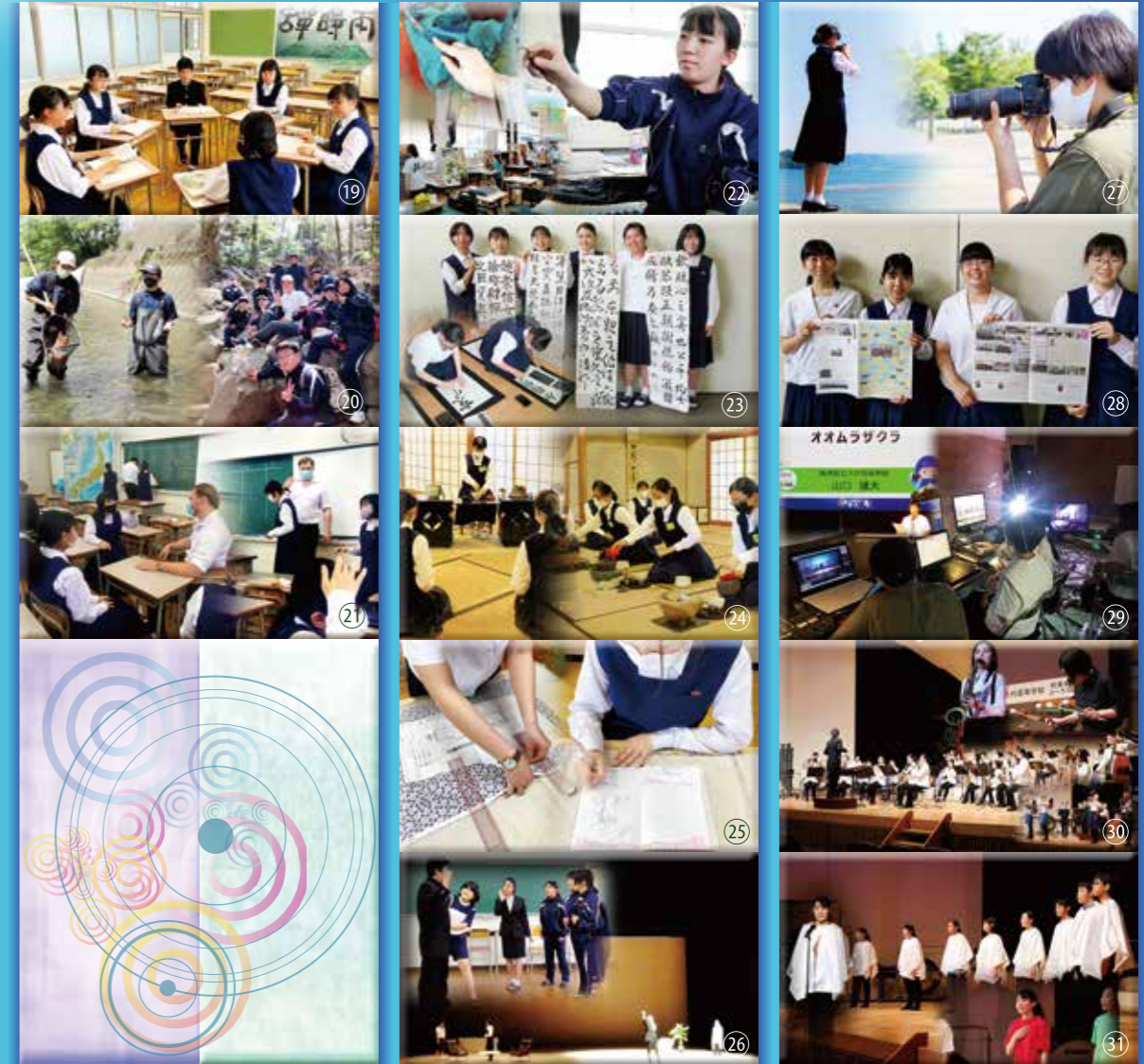
過去3年間の主な実績 (全国・九州大会レベルおよび県高総体連続優勝)