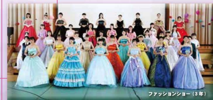
ファッションショー(3年)