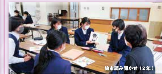
絵本読み聞かせ(2年)