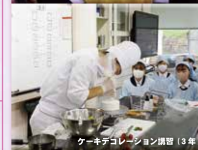
ケーキデコレーション講習(3年)