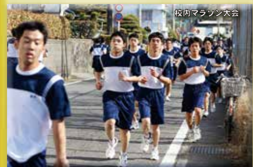
校内マラソン大会