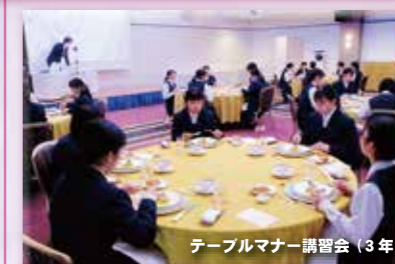
テーブルマナー講習会(3年)