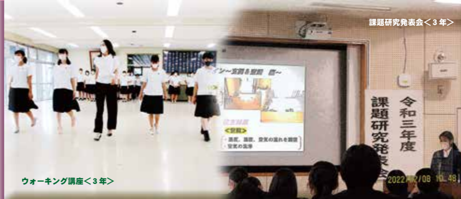
課題研究発表会<3年>