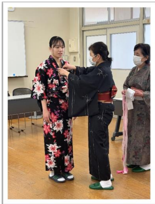
緊張気味のモデルさんです

2月10日（月）、今年度も苑田編物と裁学院の先生方をお迎えして、2年8組を対象とした「着付け講習会」を実施しました。