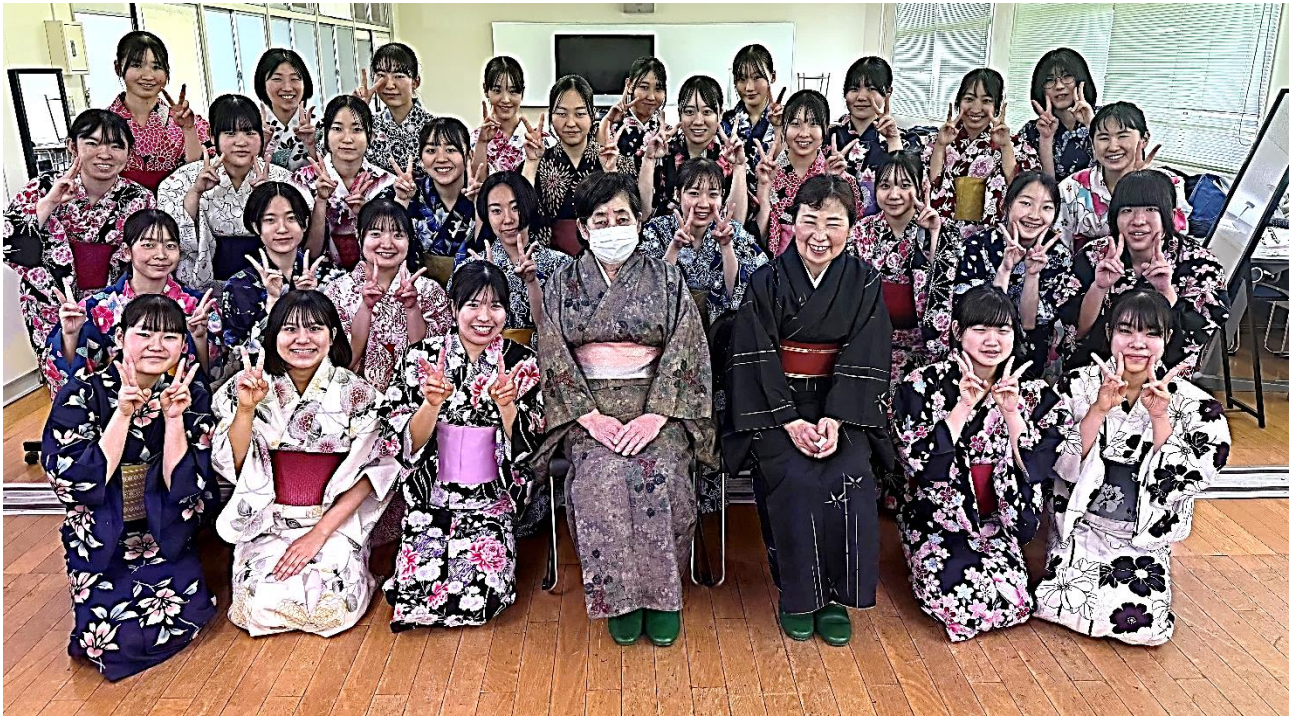
先生方と記念撮影📷