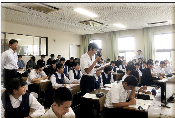
講義メモをもとに質問する生徒