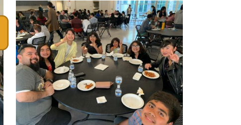
また一緒に遊ぼう！