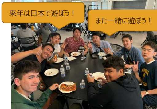
来年は日本で遊ぼう！

夜はホストファミリーとのさよならパーティーがありました。各家庭が集まり、お礼のパフォーマンスを行いました。沢山話したり、子どもたちと遊んだりしながらピザやケーキを頂きました。