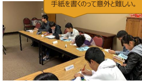
手紙を書くのって意外と難しい。