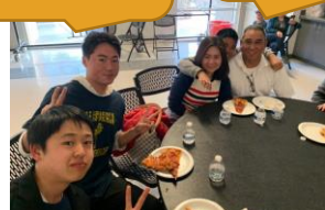
写真撮るぞ！俺の膝の上に座りなよ！