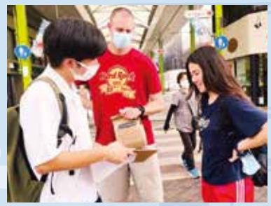
地域創生探究活動の様子

例：文系「離島教育の現状を知り、子ども達に平等な教育を」 理系「野菜や果物の非可食部分を用いた化粧品」 「終末期の患者さんに対する看護のあり方」