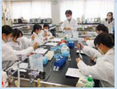
理系課題研究の様子