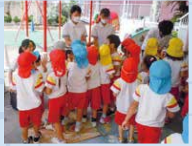
文系課題研究の様子