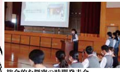
総合的な探究の時間発表会