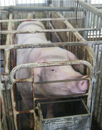
長年、お疲れさまでした。(4年間で120頭をお産しました)

本日の実習で、長年出産してきた母豚を含めて、肉豚 10 頭を佐世保食肉センターへ出荷しました。