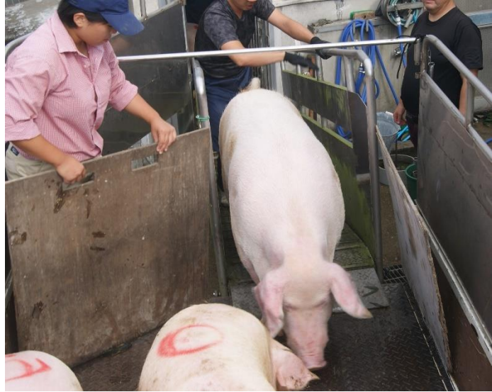
出荷用のトラックにようやく乗り込みました。