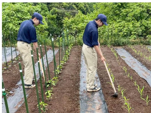
追肥用の溝づくり（3年生）