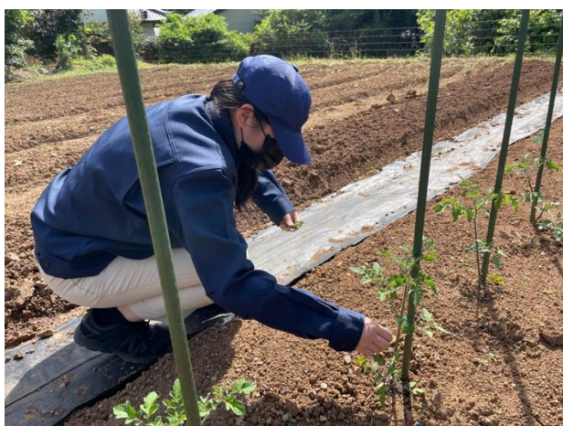
ミニトマトのわき芽取り