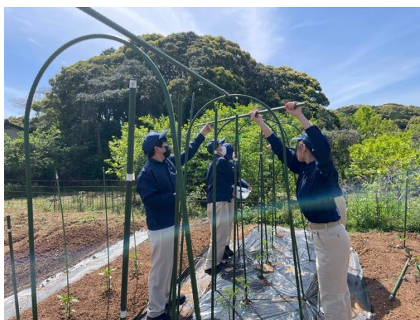
雨よけ栽培の準備