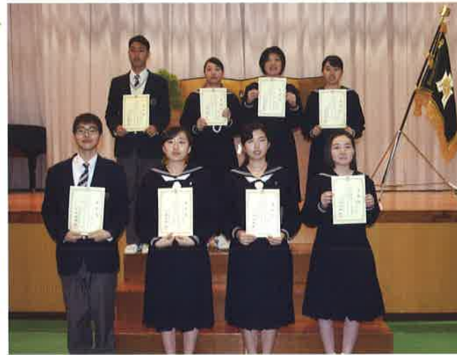
全商3種目以上 1級合格者