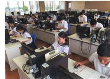
3年電子商取引 授業の様子