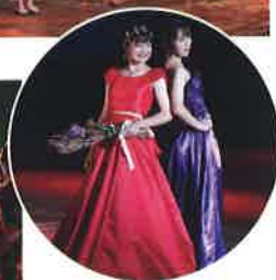
文化祭 (ファッションショー)