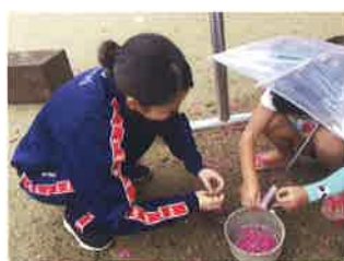
保育園実習(わかさ保育園)