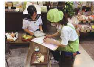
商品仕入打ち合わせ