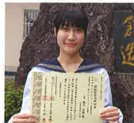
3級ファイナンシャル・プランニング技能検定合格者 (令和元年10月)

会社の帳簿作成や経営分析に役立つ全商簿記検定1級はもちろん、日商簿記2級に挑戦することができます。また、情報処理検定では、パソコンを事務処理に生かす技術を、電卓検定やビジネス文書検定では、機器を素早く正確に操作する技術を身に付けます。