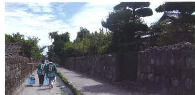
てんびん棒による移動販売の様子