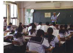
民間講師による島原学習