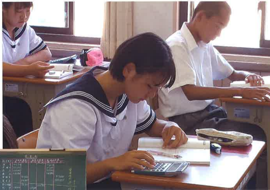
1年簿記 授業の様子