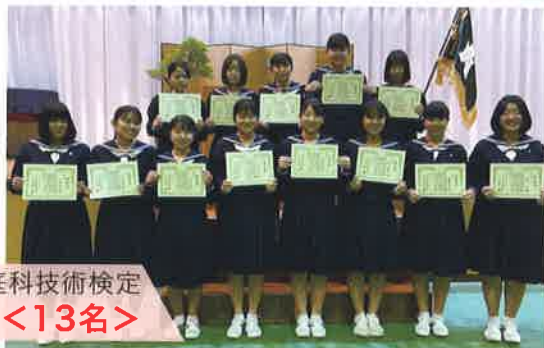
全国家庭科技術検定 三冠王<13名>