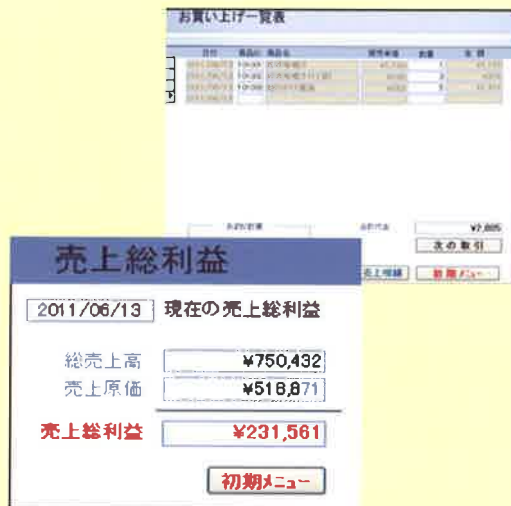
レジシステム (レジでの計算と売上分析)