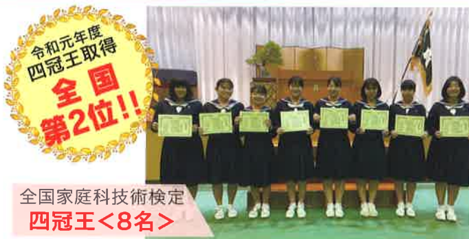
全国家庭科技術検定 四冠王<8名>