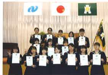
全商多種目1級合格者・ ビジネスマスター受賞者 (令和2年3月卒業生)