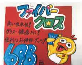
店舗づくりのためのPOP