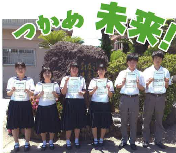
ITパスポート試験合格者

ソフトウェアの 基本的な操作方法 を習得し、1年次に全商情報処理検定3級・2級、2年次に1級の取得を目指します。3年次には、データベースソフトを使った システム設計 、 Webページの作成 、ASPによるネットワークを介した アンケート集約ページ の作成を行います。